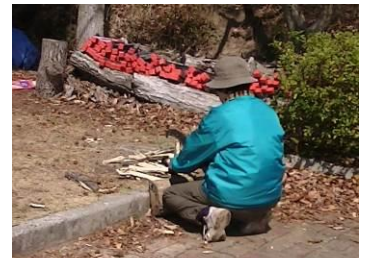
刈払機より手鎌の方が威力を発揮する場所もあり。