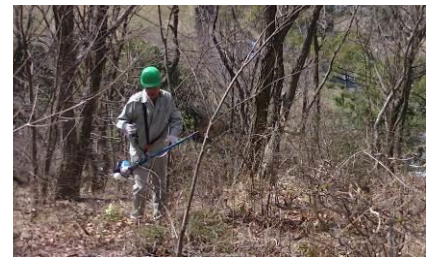
過日刈払機の安全講習を終えたメンバーも今後は大きな戦力として期待大。