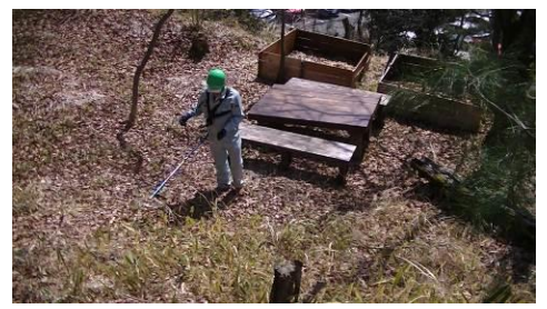
今月はひたすら下草刈りに時間を費やすことになった